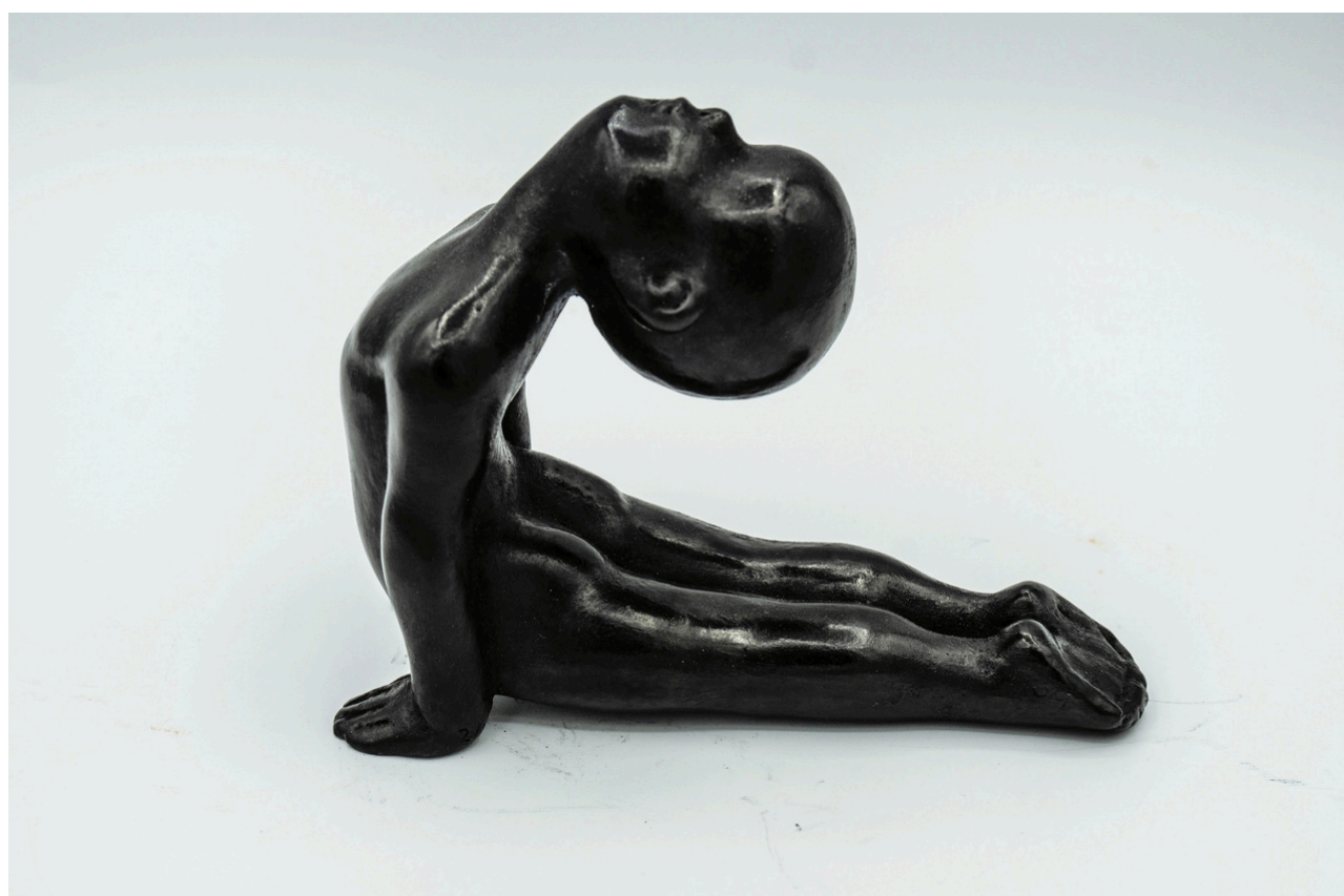
Urdhva Mukha Śvānāsana - Chien tête en haut - 9 x 6 x 12 cm, 1,05 kg