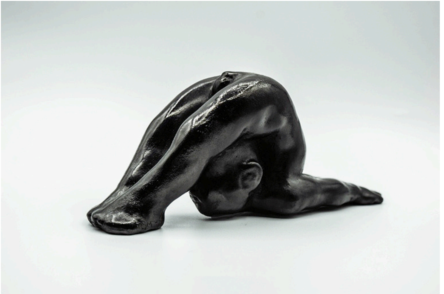
Viparīta Śalabhāsana - Sauterelle en inversion - 6,9 x 5 x 17 cm, 1,35 kg