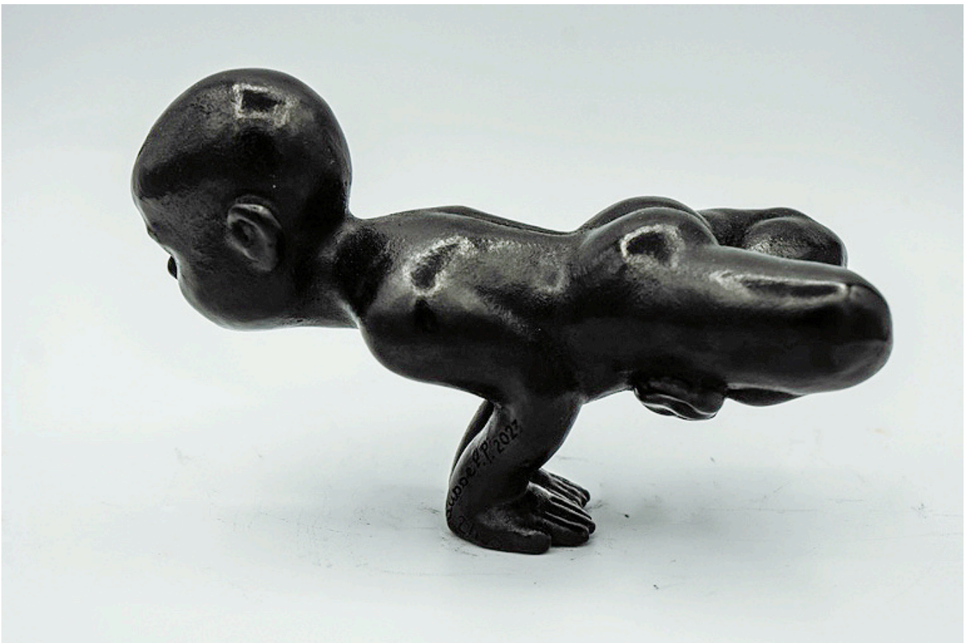
Padma Mayūrāsana - Paon en lotus - 8 x 8 x 14 cm, 1,20 kg