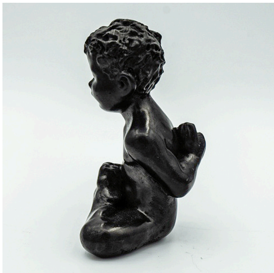
Kandāsana - Oignon - 10,6 x 8 x 6,5 cm, 1,05 kg