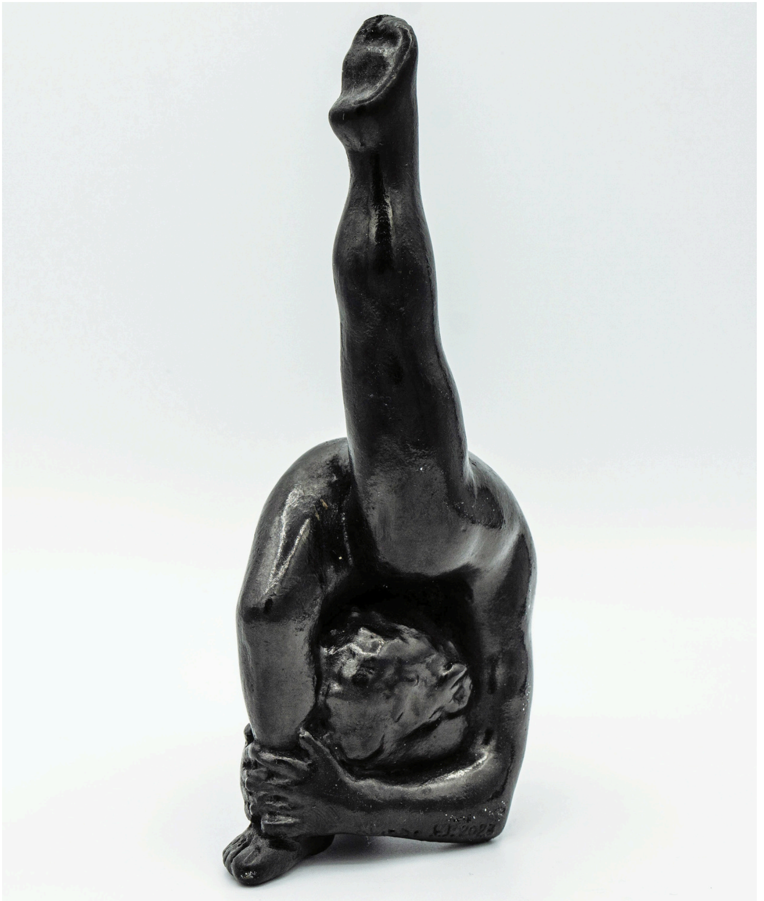
Eka Pada Viparīta Daṇḍāsana - Sceptre inversé - 15 x 4,5 x 8,2 cm, 0,95 kg