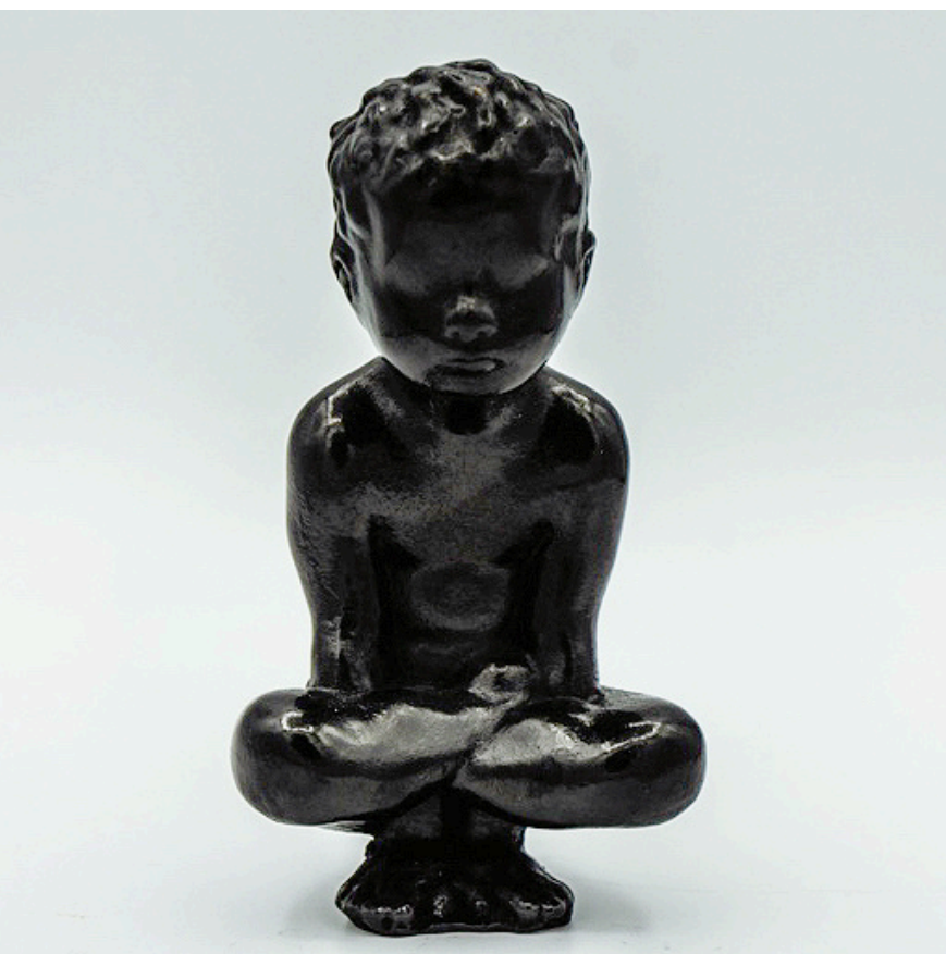
Kukkuṭāsana - Coq - 12 x 7 x 6,3 cm, 1,20 kg