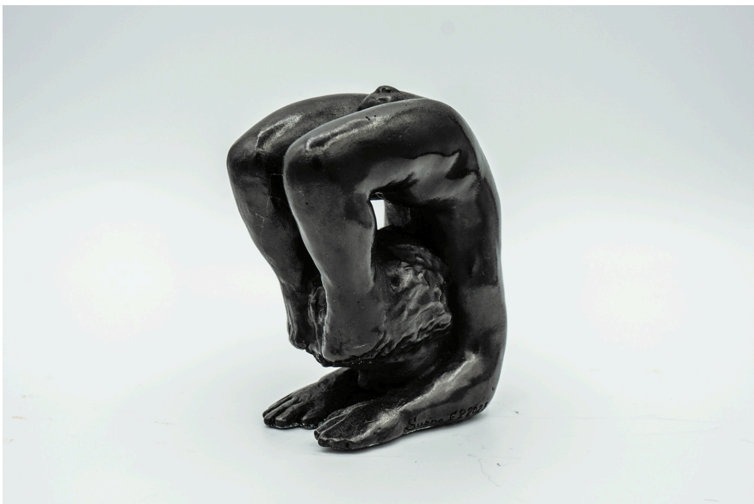
Vrschikasana - Scorpion - 8,8 x 5 x 8 cm, 1,25 kg