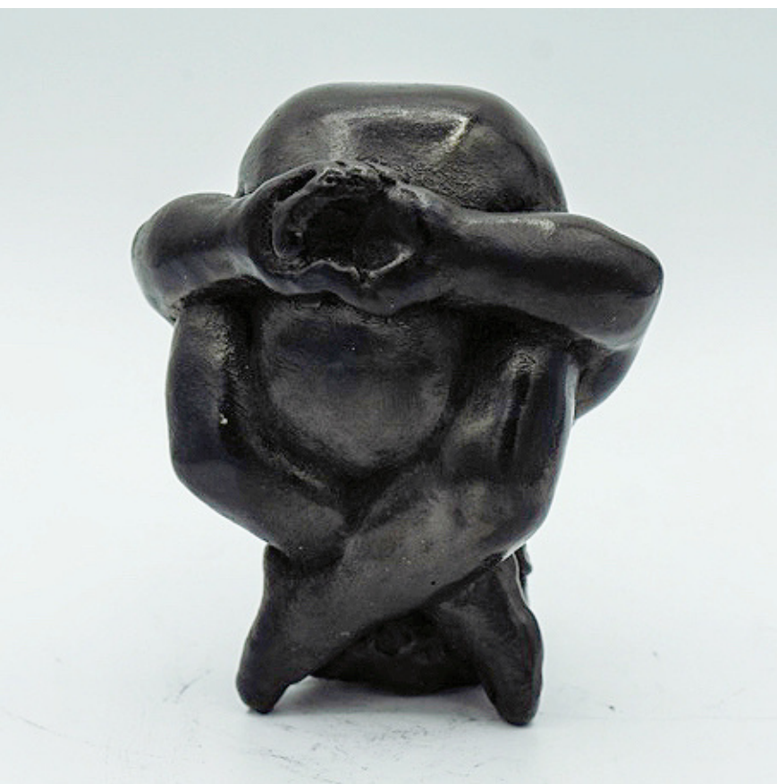
Sīrsa Kūrmāsana - Tortue sur la tête - 9 x 8 x 7 cm, 1,20 kg